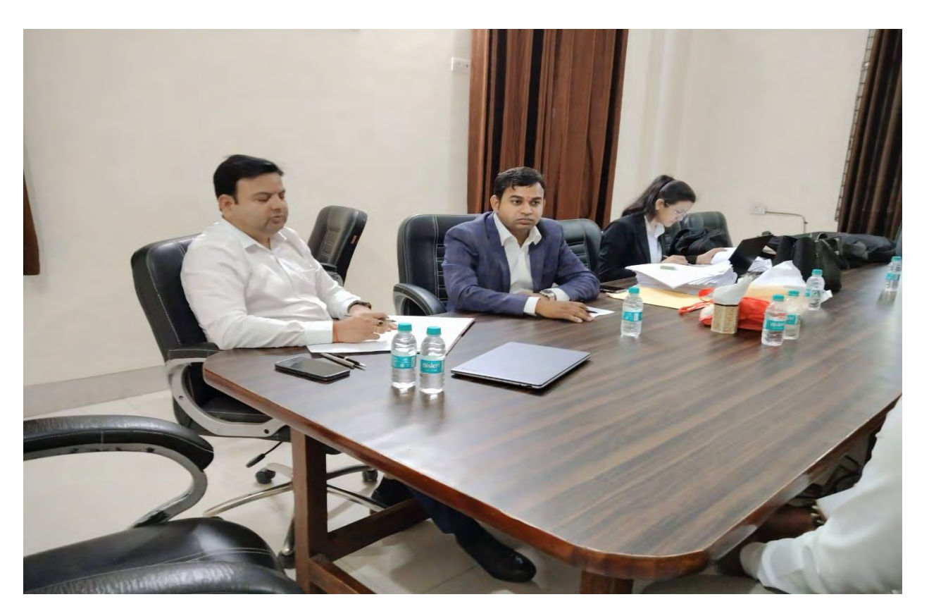
Students Interview process