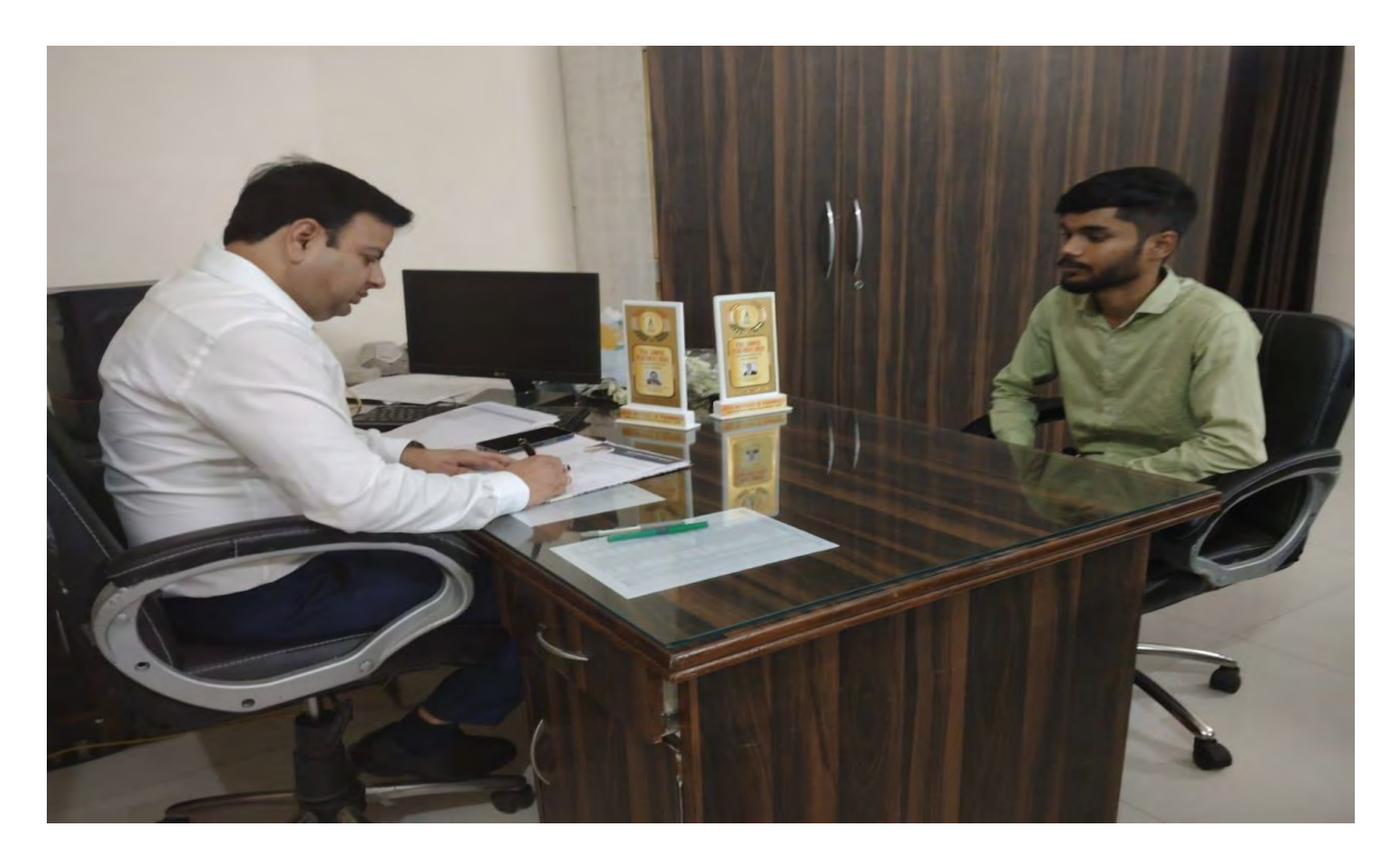
Students Interview process