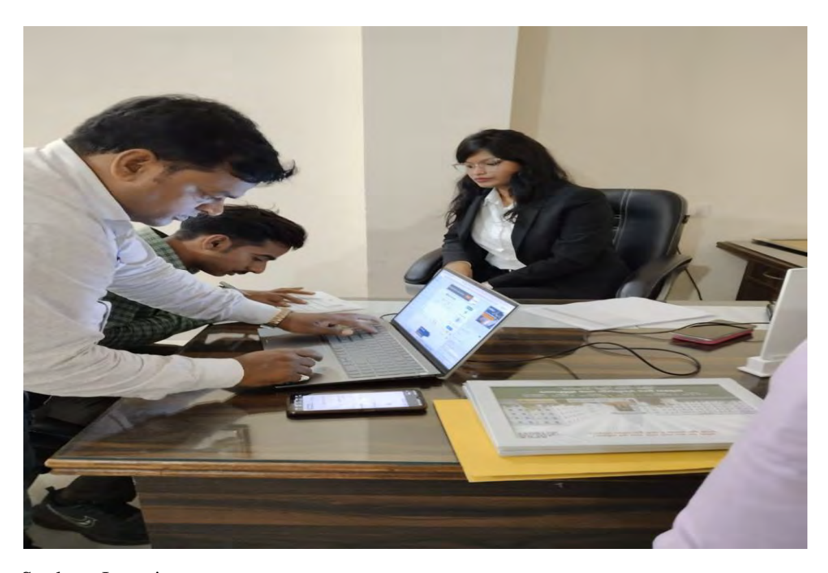
Students Interview process